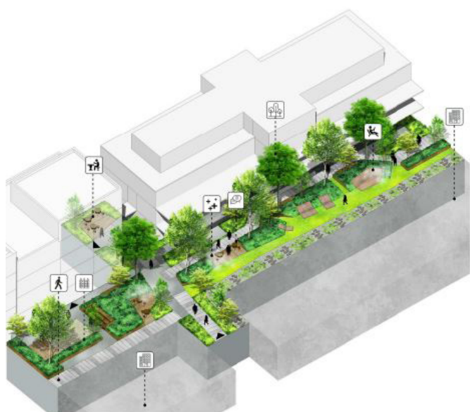
/ Le jardin intérieur